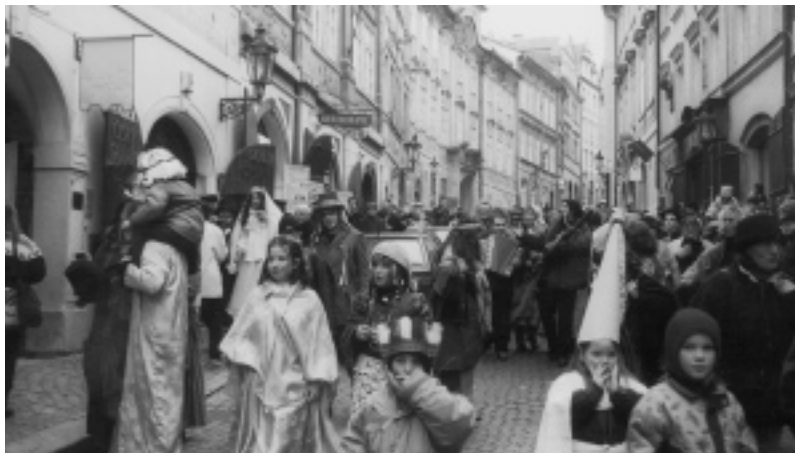
Malostranské masopustní veselí

Petřínská rozhledna slaví 111 let! Dne 24. března 2002 byla po rozsáhlé oprave