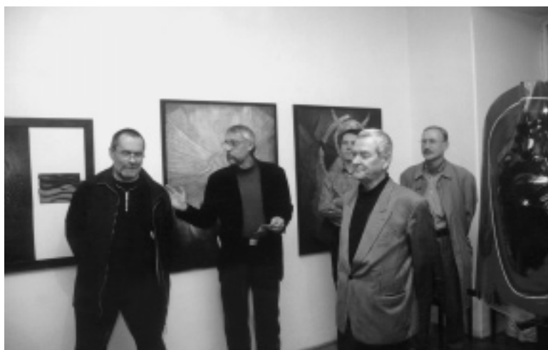
Jubilanti S.V.U. Mánes