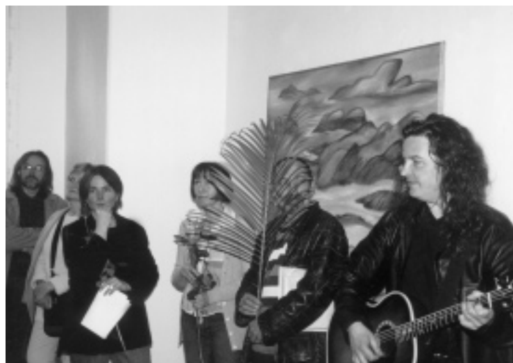
Cosi v krajině