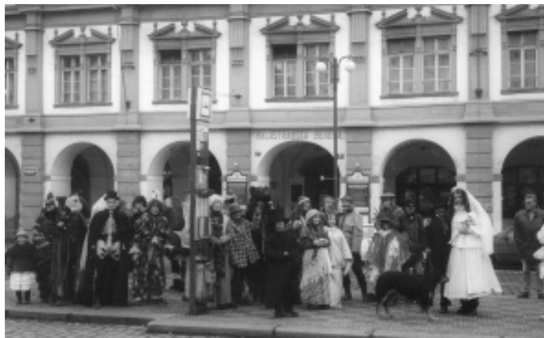
Malostranské masopustní veselí