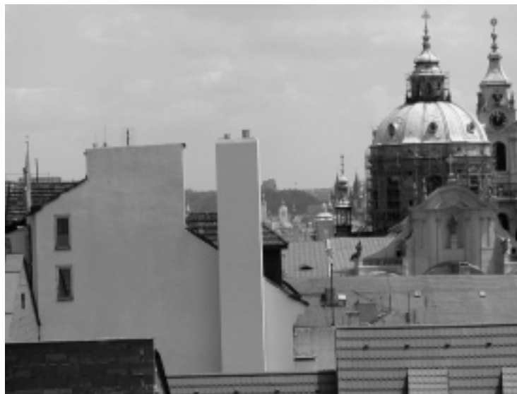
Nový komín v Nerudovce 15

kusovaly do mimořádně cenné lokality, která velmi pravděpodobně skrývá svědectví o podobě historického opevnění zbudovaného Přemyslem II. a kde se možná nalézají i další